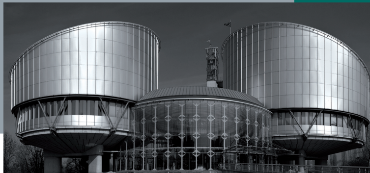
Colloque validé au titre de la formation continue des avocats